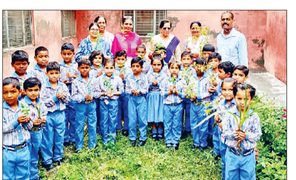
भिवानी। पौधरोपण करते शिक्षक व विद्यार्थी।

वे अधिक से अधिक पौधों का रोपण करें तथा पर्यावरण के प्रति अपने दायित्व का निर्वहन करें। सीजेएम ने सभी से आह्वान किया कि वे अपने जन्मदिन पर एक पौधा अवश्य रोपित करें।