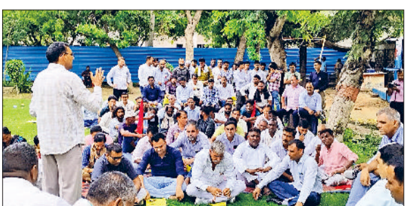
भिवानी। हड़ताल को लेकर कर्मचारियों को संबोधित करता एक वक्ता।