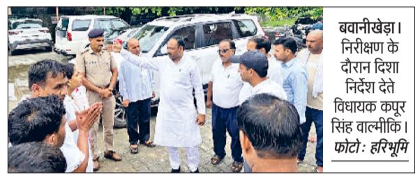
बवानीखेड़ा। निरीक्षण के दौरान दिशा निर्देश देते विधायक कपूर सिंह वाल्मीकि।

विधायक कपूर वाल्मीकि ने स्थानीय अस्पताल का निरीक्षण किया और कंडम भवन को जल्द ही हाई-टेक तकनीक भवन में तबदील होने के भी शुभ संकेत दिए। उन्होंने बताया कि हॉस्पिटल में मौजूद कमियों को दूर करने के लिए ठोस कदम उठाए जाएंगे, जिससे मरीजों को उत्कृष्ट स्वास्थ्य सेवाएं प्रदान की जा सकें और उनके जीवन में सकारात्मक परिवर्तन लाया जा सके। इसके अलावा, बवानी खेड़ा हॉस्पिटल में 50 बेड से 100 बेड तक नई बिल्डिंग का निर्माण कार्य शुरू किया जाएगा, जिससे स्थानीय लोगों को बेहतर स्वास्थ्य सेवाओं का लाभ मिलेगा और उनके जीवन में गुणात्मक सुधार होगा।