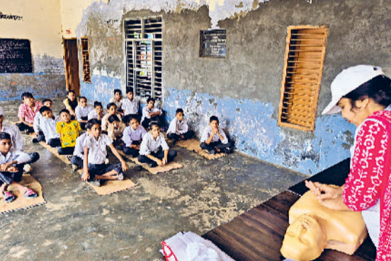
भिवानी। विद्यार्थियों को फर्स्ट एड की जानकारी देती फर्स्ट एड प्रवक्ता।