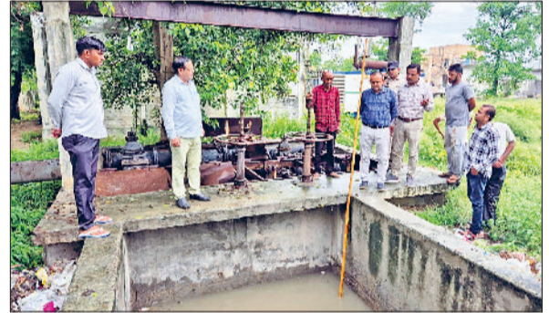
तोशाम। बरसाती पानी की निकासी की व्यवस्था जांचते एसडीएम।

एसडीएम ने जनस्वास्थ्य विभाग के अधिकारियों को बरसाती सीजन के दौरान निस्तारण पर लगी मोटर पर कर्मचारियों की स्थाई इयूटी लगाए जाने के निर्देश दिए। उन्होंने कहा कि सम्बंधित अधिकारी मानसून सीजन में पानी निकासी के