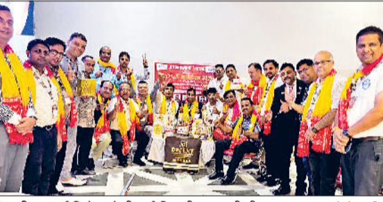
भिवानी। अवार्ड विजेता जेसीआई भिवानी स्टार की टीम।