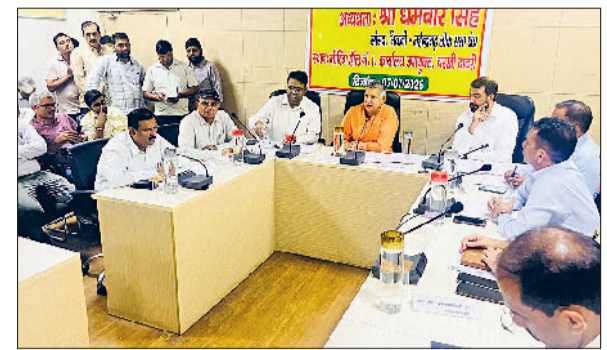
चरखी दादरी। बैठक में अधिकारियों को निर्देश देते सांसद धर्मवीर सिंह।

लघु सचिवालय स्थित सभागार में सोमवार को जिला विकास समन्वय एवं निगरानी समिति की बैठक सांसद धर्मवीर सिंह की अध्यक्षता में हुई। बैठक में सांसद ने निर्देश दिए कि जिले के उन गांवों के वाटर टैंकों को पानी से भरना सुनिश्चित करें, जहां पेयजल किल्लत होती है। उन्होंने कहा कि नागरिकों के समक्ष पेयजल समस्या नहीं बननी चाहिए। इसके साथ शहर सहित जिन क्षेत्रों में जलभराव की समस्या है, उसका स्थायी समाधान किया जाए। सरकार इस समस्या के समाधान के